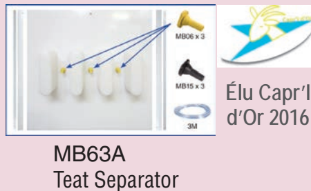
MB63A Teat Separator