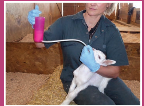
Étape 3 - Soulever le flacon