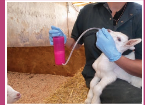
Étape 2 - Le maintenir en position