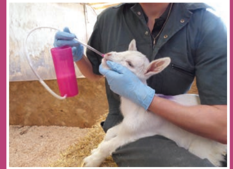
Étape 1 - Introduire le tube souple